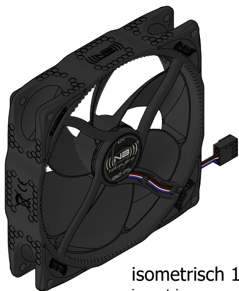
isometrisch 1:2 isometric